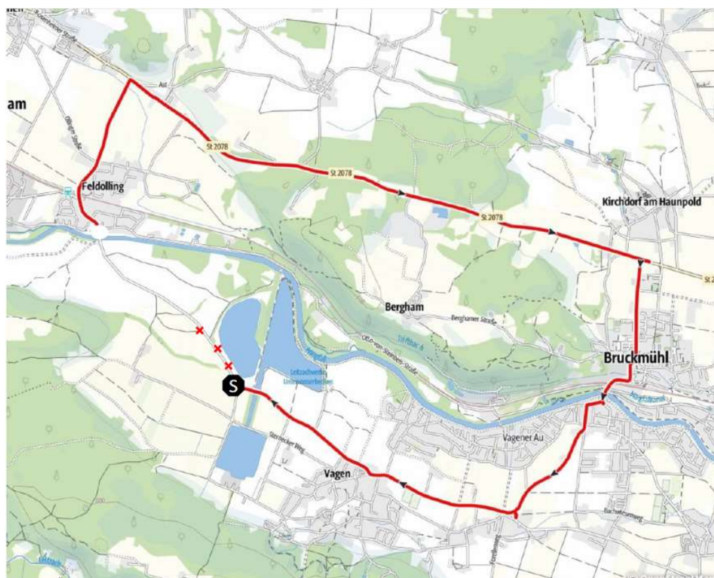
Abb. 1: Umfahrung während der Sperrzeiten der Kreisstraße RO13 beim HRB Feldolling

Die Bauarbeiten am Hochwasserrückhaltebecken (HRB) Feldolling laufen planmäßig. Dieses Jahr waren dazu bereits in den Sommer- und Pfingstferien Teil- bzw. Vollsperrungen der Kreisstraße R013 zwischen Vagen und Feldolling erforderlich.