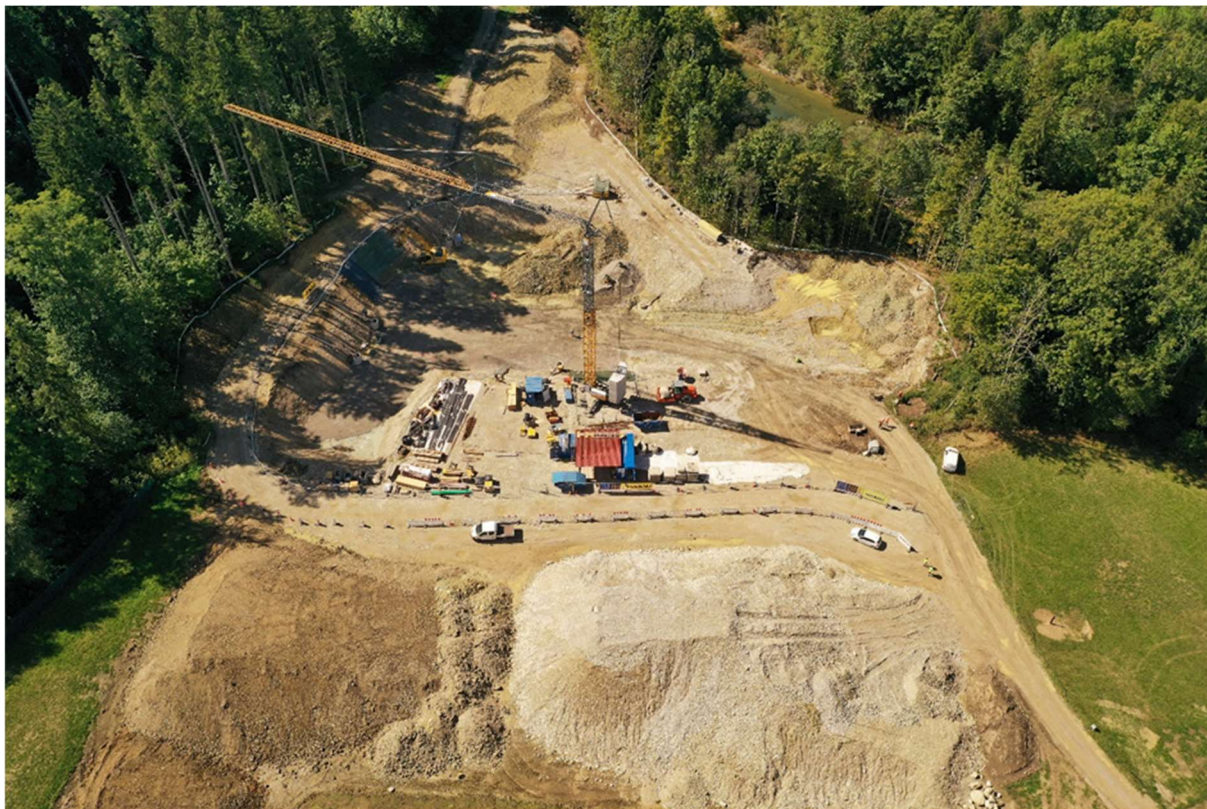
Abb. 1 Baufeld des Einlassbauwerkes im September 2022